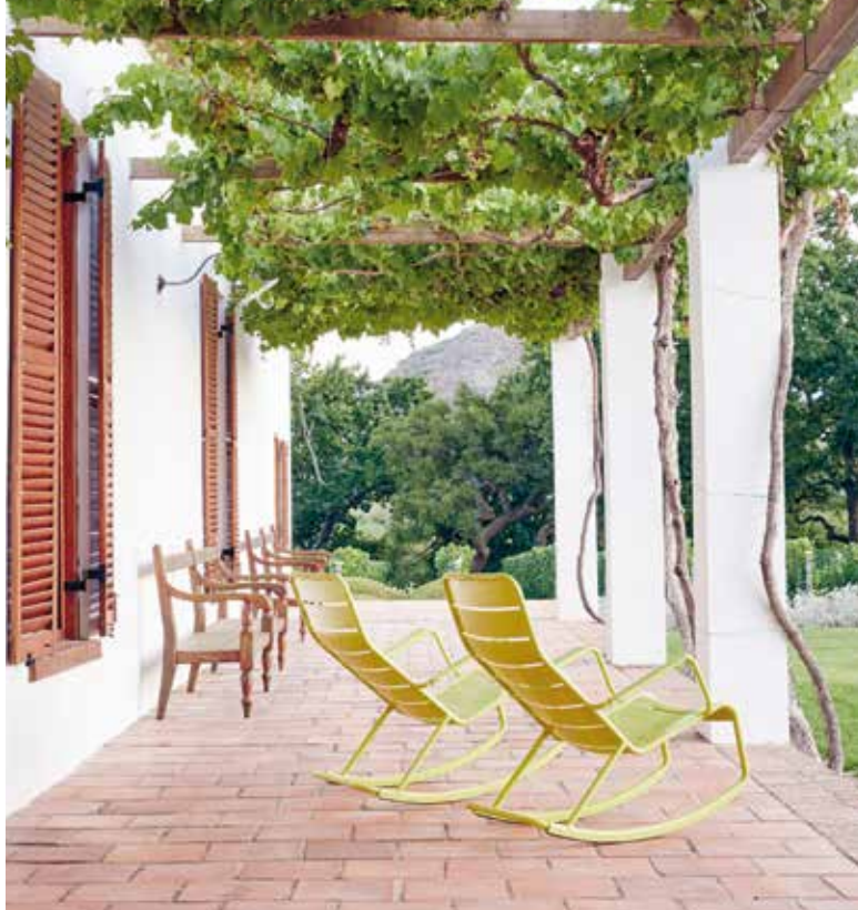
Het terras met de door wijnranken bekleedde pergola biedt een prachtig uitzicht over de iconische tuinen van Babylonstoren met daarachter het Drakensteingebergte. De groene stoelen van Frédéric Sofia (Fermob) verwijzen charmant naar de houten schommelstoelen van weleer.

Dineren, deelnemen aan een wijnproeverij of overnachten in een van de bijgebouwen op het landgoed? Kijk voor meer informatie op www.babylonstoren.com