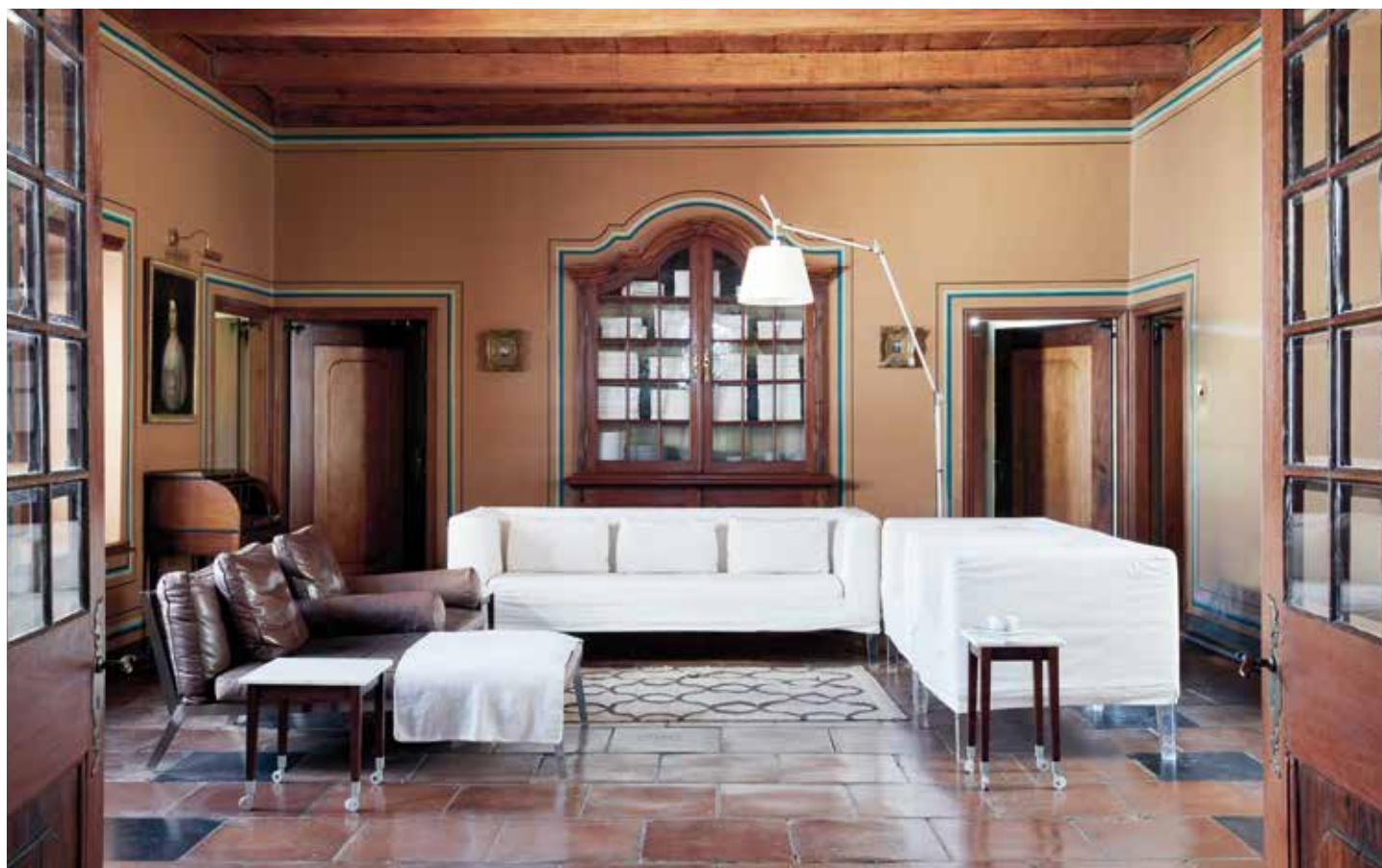
Een dubbele deur voert naar de zitkamer, die is ingericht met crèmekleurige banken van Philippe Starck (Driade), luxeux leren fauteuils van Citterio (Flexform) en een Artemide vloerlamp. De eigentijdse elementen verbinden het verleden met de toekomst en vormen de sleutel tot de frisheid van het huis.