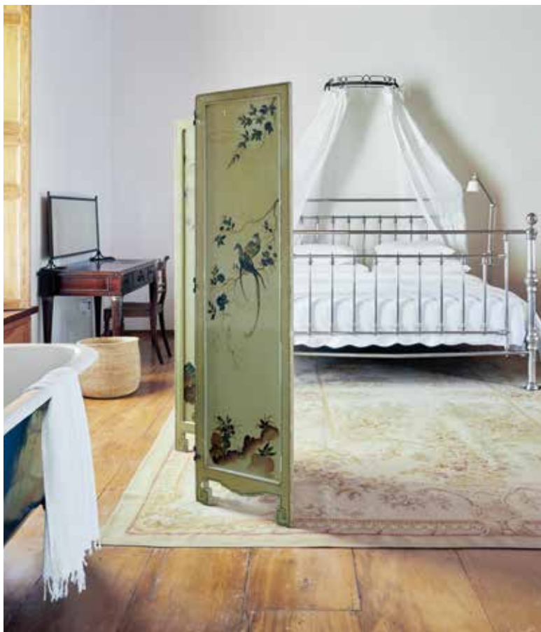
De slaapkamer is een prachtig voorbeeld van ingetogen luxe, van het kingsize bed tot het vloerkleed in pasteltinten. Het handgeschilderde Chinese kamerscherm camoufleert het bad in Victoriaanse stijl in de hoek van de slaapkamer.