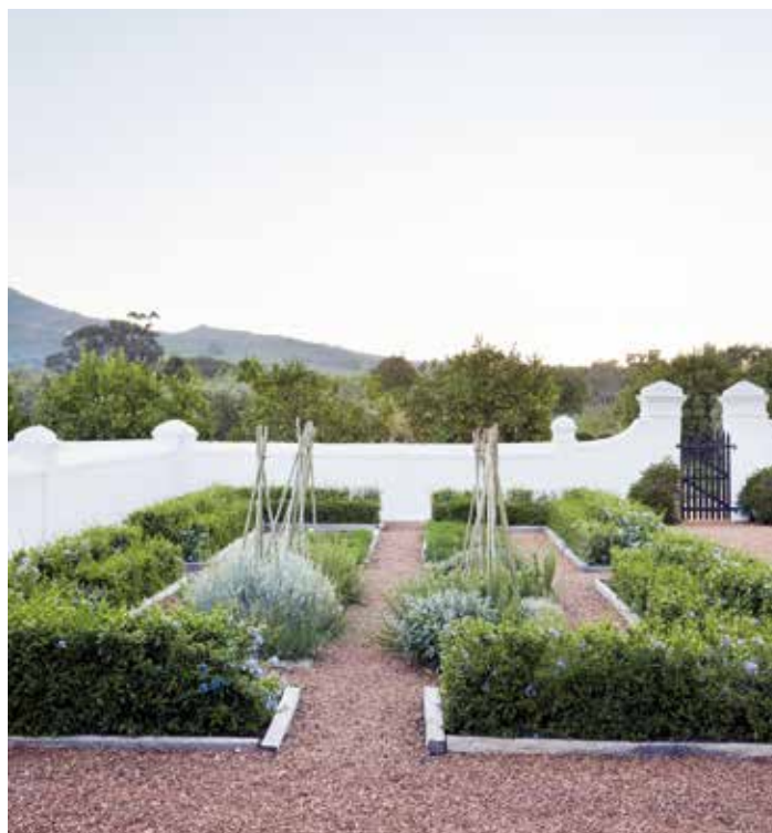
De werf (boerenhof) van Babylonstoren wordt beschouwd als een van de best bewaarde voorbeelden van de Kaaps-Hollandse stijl.