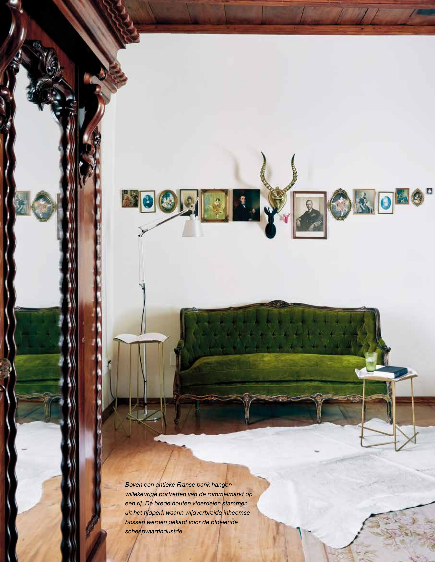
Boven een antieke Franse bank hangen willekeurige portretten van de rommelmarkt op een rij. De brede houten vloerdelen stammen uit het tijdperk waarin wijdverbreide inheemse bossen werden gekapt voor de bloeiende scheepvaartindustrie.