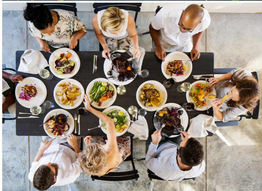
Der Luxus der Natürlichkeit: In enger Absprache mit den Gärtnern wird im Restaurant Babel serviert, was morgens noch an Baum oder Strauch hing, auf dem Feld wuchs oder tief im Erdreich vergraben war.